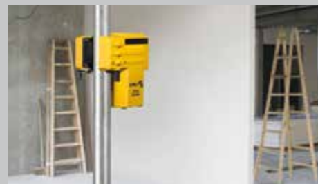
Dispositivo de fijación integrado