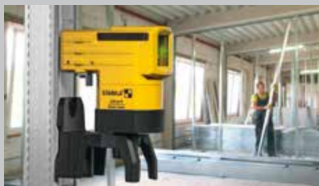
Potente sistema de imanes de neodimio