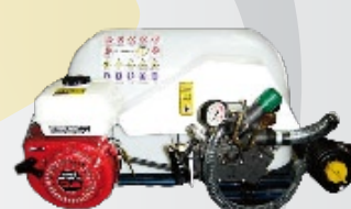
Motor Honda GX-160 Bomba membrana udor