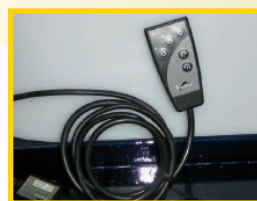
Mando Ultrasonar 1 Lado