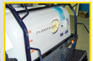
Ganchos porta mangueras