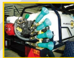
Columna 3-4 Pulverizadores