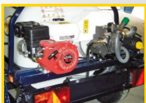
Grupo Honda udor