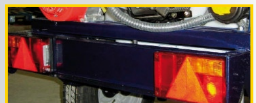
kit de luces

Mas de 80 años al servicio del agricultor