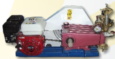
Motor Honda GX-200 Bomba pistones Abella