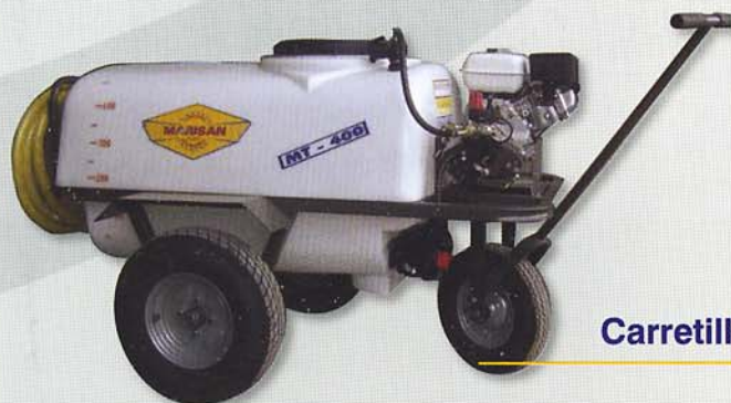
Carretilla 400 l.