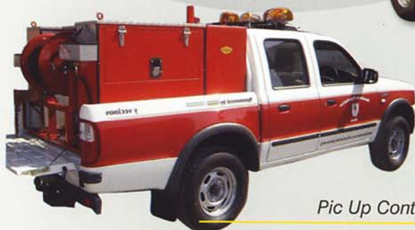
Pic Up Contraincendios

Mas de 80 años al servicio del agricultor More than 80 years at farmer's service