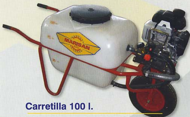
Carretilla 100 l.