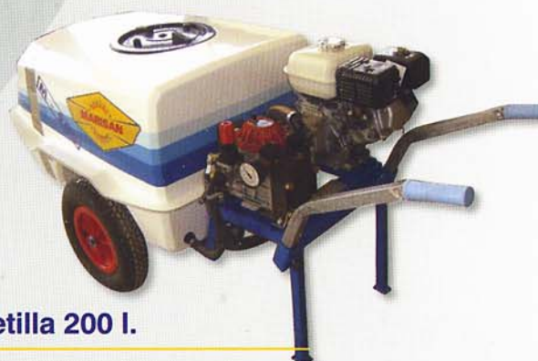
Carretilla 200 l.