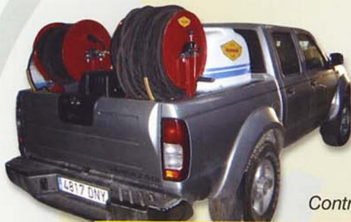
Pic Up Contraincendios