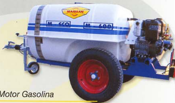
Coche Motor Gasolina