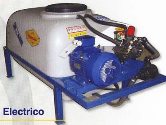
Bancada Motor Electrico