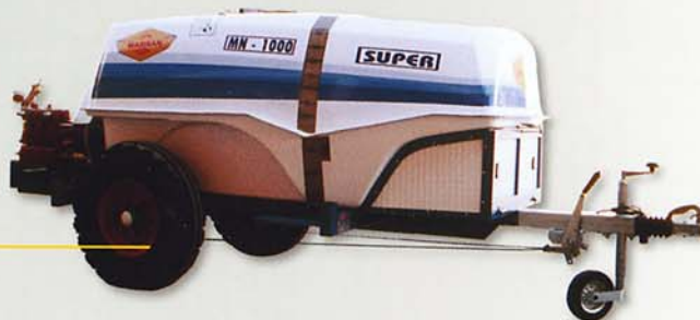
Coche Motor Diesel