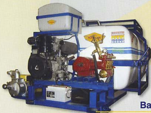
Bancada Motor Diesel