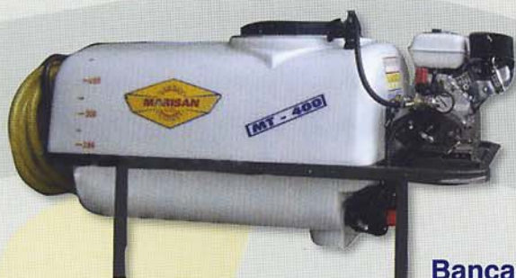
Bancada Motor Gasolina