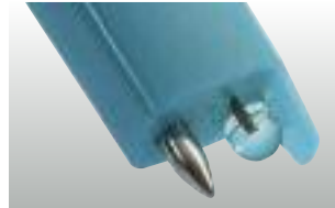
testo 206-pH1: sonda pH1 para líquidos