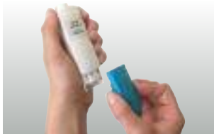
Cambio sencillo de sonda en los testo 206-pH1/-pH2/-pH3