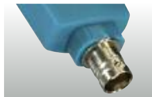
testo 206-pH3: Módulo pH3 con conector BNC