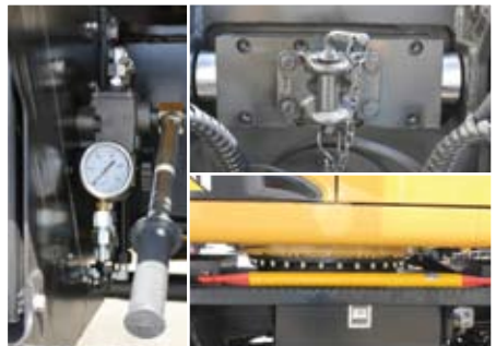
Barrón de rescate.

Tiro de rescate delantero y trasero de bulón de 40, para remolcar cargas ligeras o diplorys sin asistencia de freno.