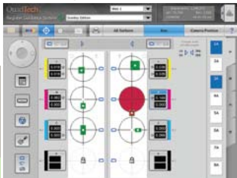
Pantalla Funcionamiento del Sistema de Guía de Registro