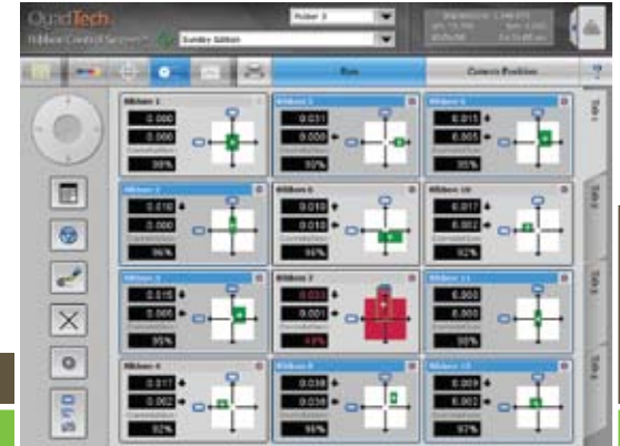
Pantalla Funcionamiento del Sistema de Control de Tiras de Papel Continuo

La cámara multifuncional QuadTech® MultiCam® puede consolidar toda la funcionalidad de registro de color a color, control de corte y tira de papel continuo de sus controles de la prensa en un sistema de alto rendimiento y alta velocidad. Puede adaptar sus controles a la tarea en cuestión, en lugar de que ocurra lo contrario.