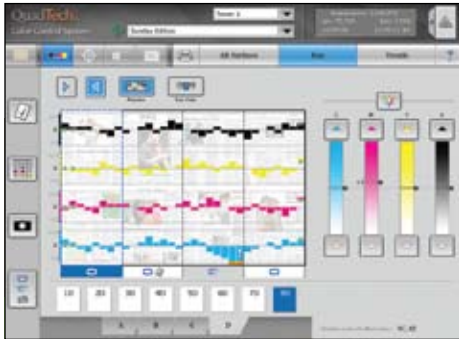
Pantalla Funcionamiento del Sistema de Control de Color