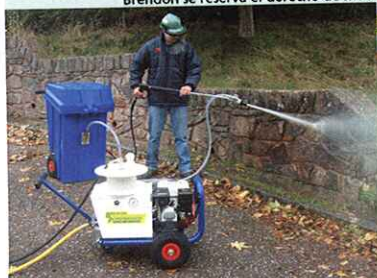
Limpieza chorro arena

Sistema químico: Sistema químico de alta presión dosificado con manguera de entrada de producto químico y filtro (solo opera con alimentación por succión)