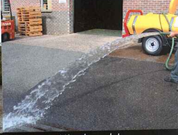
Kit de achique