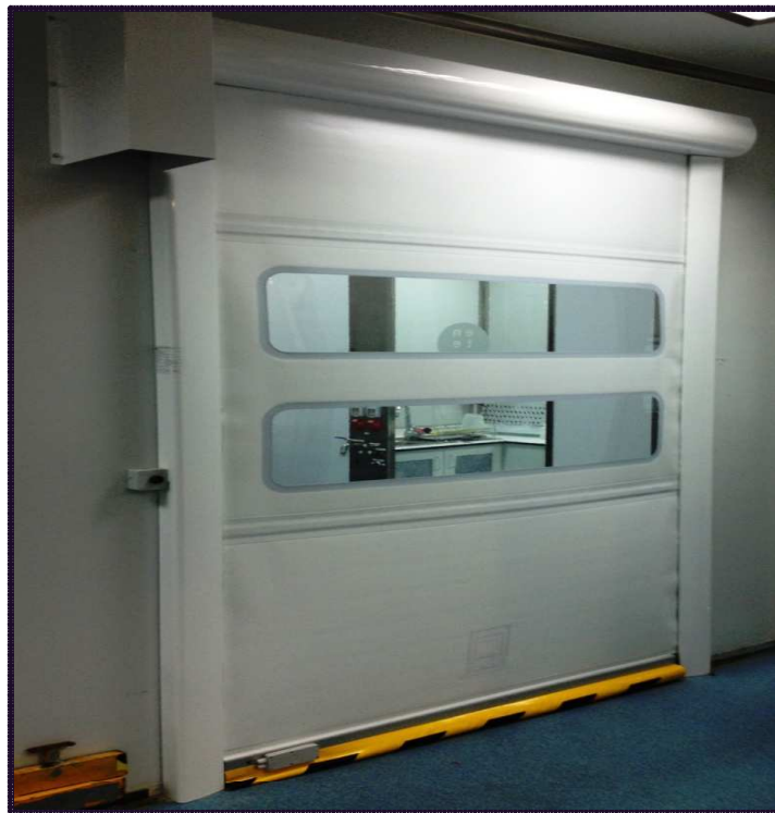
PUERTAS DE PASO

Nuestra puerta rápida SD-CLEAN estructura de aluminio esmaltado en blanco RAL 9010 ó anodizado en plata (con tratamiento antihumedad), posibilidad de lacar otros colores, la mejor solución para salas blancas, laboratorios y zonas de ambiente controlado. Diseñada para soportar un gran tránsito fluido sin interferir a las personas, maquinaria, materiales. Acabado en acero inoxidable AISI-304 se fabrica los modelos SDEP y SDEN.