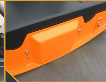
Patines con sistema patentado WIDEST, que aporta un ancho extra de trabajo y mayor solape de las cadenas en la parte central.