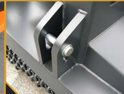
Deslizamiento en los anclajes a los brazos del tripulante para favorecer la total adaptación al terreno con independencia del tractor.