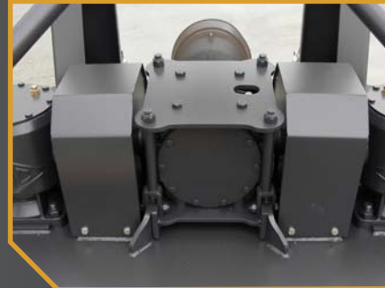
Acoplamiento flexible de unión entre grupos para amortiguar impactos al tractor.

Chasis robusto y con una rigidez muy elevada para las situaciones más exigentes. Está compuesto de chapa de alta resistencia conformada en frío y ensamblada mediante unión soldada.