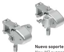
Nuevo soporte M3 New M3 support Nouveau support M3 Nouvo supporto M3