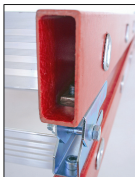
Bisagra de acero