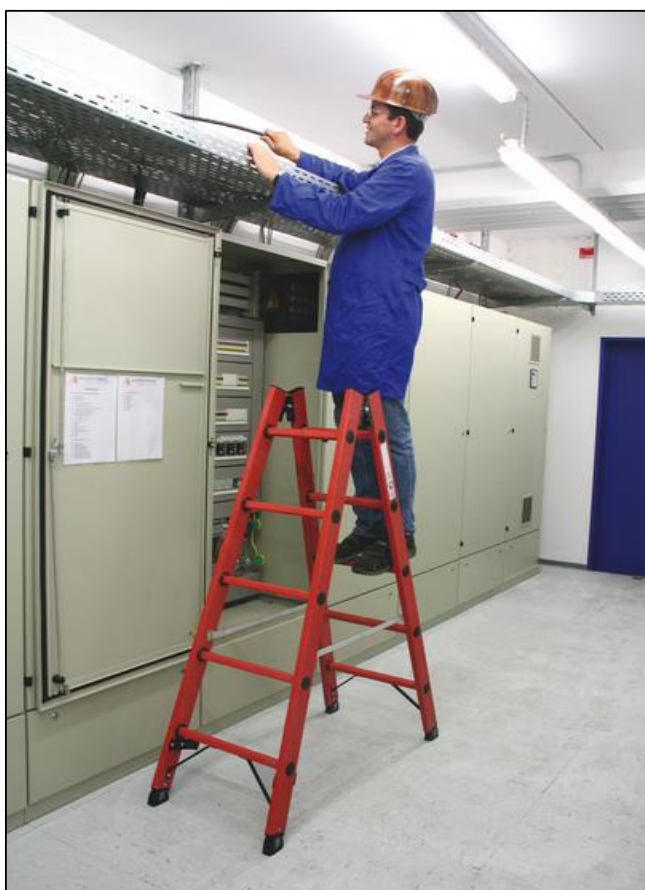
Foto: Ref. 36405 de 2x5 peldaños