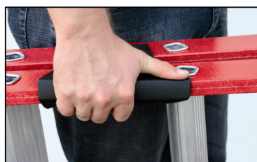
Ergo-Pad para su mejor manejo