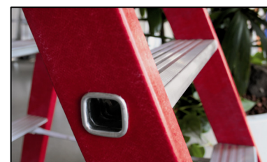
Peldaño plano de 80 mm