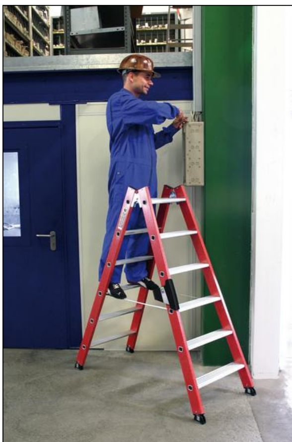
Foto: Ref. 34112 de 2x6 peldaños