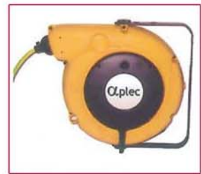
▲ Enrollador eléctrico - opción Electric cable reel - option