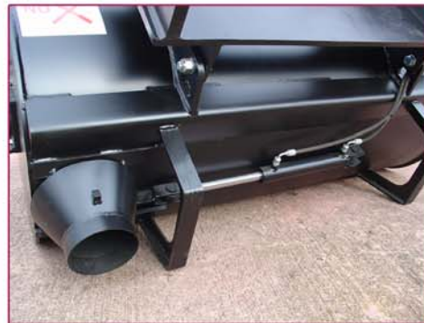
▲ Sistema de vaciado inferior Bottom discharging system