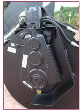
▲ Transmisión por reductor Gearbox system