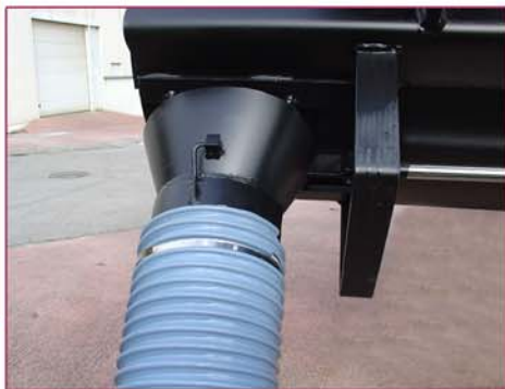
▲ Tubo de vaciado para encofrados Discharging tube