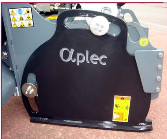
▲ Patín con autonivelación independiente Self levelling of both slides