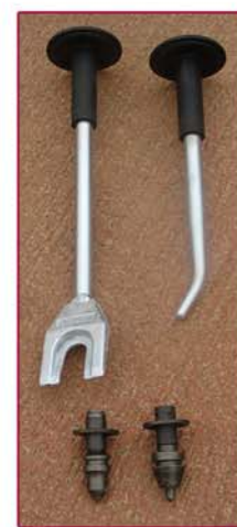
▲ Llaves y Picas Keys and tools