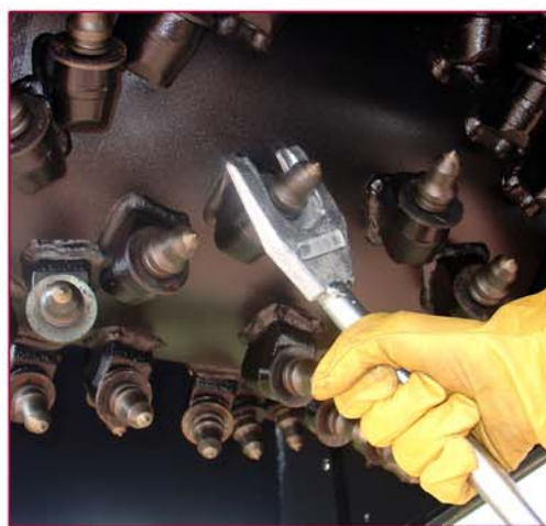
▲ Tambor y llave para extraer las picas Drum and key to takeout the tools