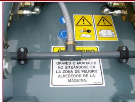
▲ Sistema de riego (opcional) Sprinkler system (optional)