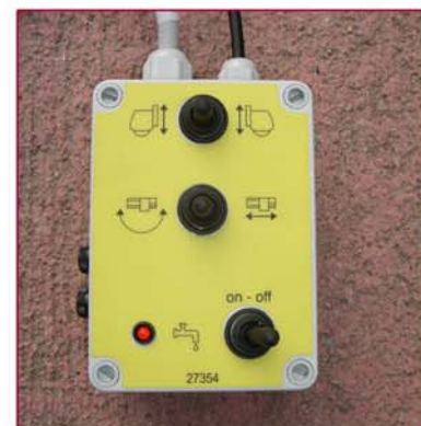
▲ Botonera control de movimientos Switch controls for movements