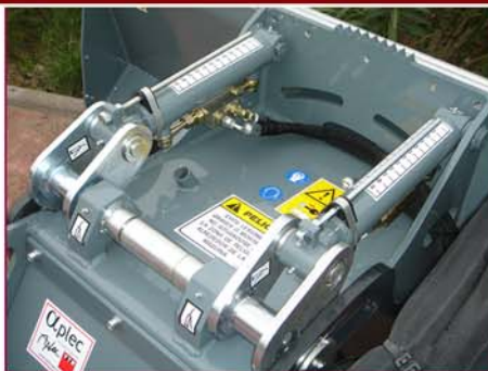
▲ Control de profundidad mecánico (hidráulico opcional) Mechanical depth control (hydraulic optional)