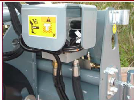
▲ Desplazamiento lateral hidráulico Hydraulic sideshift