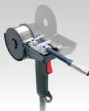
Antorcha Spool Gun

046283 4 m 3 kg 220 A (20%) ⚙️ 0.8 → 1.2