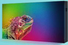
INTERIOR O EXTERIOR