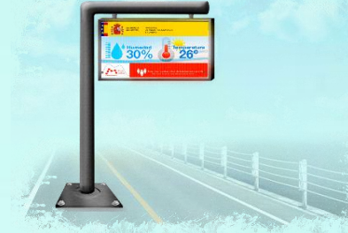
POSTE CON PANTALLA