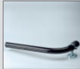
Boquilla de extracción EN-40 para electrodos de 40 cm máximo.