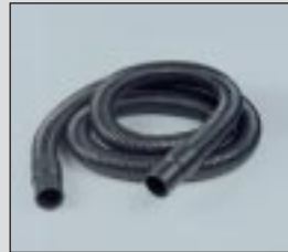
Manguera longitud 2,5 m H 2,5/45; Longitud 5 m H 5,0/45.