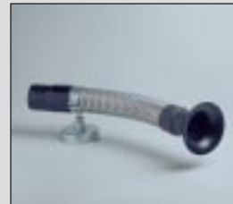
Boquilla del conducto de extracción de humos EN-20.