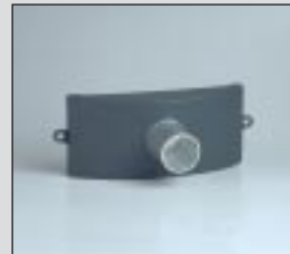
Conexión de la manguera HCH 45 para eliminar los humos de soldadura filtrados, p.e. cuando se suelda acero inoxidable.