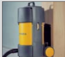
Soporte para montaje en pared MBH.