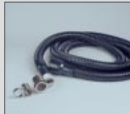
Boquillas terminales que proporcionan capacidad de extracción a los sopletes de soldadura estándar, de tipo NKT para la extracción superior, y de tipo NKC para la extracción anular.