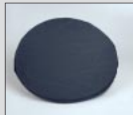
Filtro de carbono activo FAC HV para neutralizar los olores.