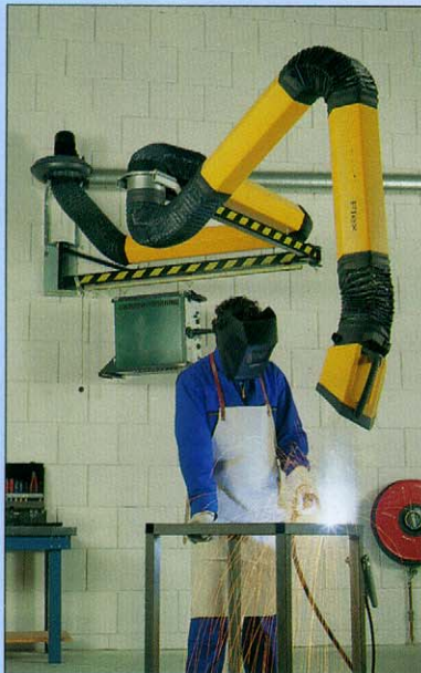
Un ejemplo práctico de la prolongación NEC 4.

Las prolongaciones Euromat NEC 2 y NEC 4 son estructuras tubulares muy sólidas para un mayor alcance de los brazos aspiradores Flex y UltraFlex, con un precio muy interesante. El NEC 4 está compuesto por el NEC 2 y una pieza articulada de extensión. Gracias a este segundo punto de articulación, el NEC 4 tiene un grado de flexibilidad sumamente elevado y, en combinación con el brazo aspirador Flex/UltraFlex 4, tiene un radio de trabajo máximo de hasta 8 metros. Ambos tubos están equipados con el sistema HandyStop®. Este sistema permite bloquear el sistema en el lugar deseado, facilitando la manipulación del brazo aspirador.