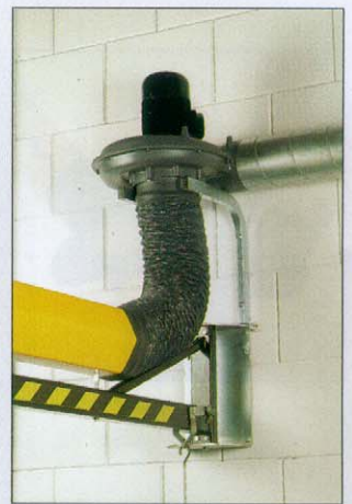
El sistema HandyStop®.

Las prolongaciones Euromat NEC 2 y NEC 4 son estructuras tubulares muy sólidas para un mayor alcance de los brazos aspiradores Flex y UltraFlex, con un precio muy interesante. El NEC 4 está compuesto por el NEC 2 y una pieza articulada de extensión. Gracias a este segundo punto de articulación, el NEC 4 tiene un grado de flexibilidad sumamente elevado y, en combinación con el brazo aspirador Flex/UltraFlex 4, tiene un radio de trabajo máximo de hasta 8 metros. Ambos tubos están equipados con el sistema HandyStop®. Este sistema permite bloquear el sistema en el lugar deseado, facilitando la manipulación del brazo aspirador.