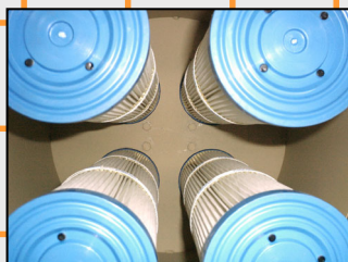
Mediante cuatro cartuchos se obtiene una superficie filtrante de 8,8 m².