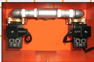
Dos electroválvulas controlan los impulsos de aire comprimido.