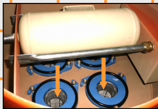
Con gran fuerza se introduce el aire comprimido dentro de los cartuchos de filtraje, limpiándolos.