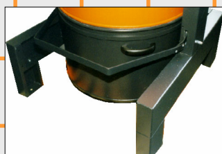
Depósito herméticamente cerrado. Se pueden aplicar bolsas de plástico desechables.