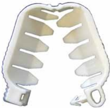
Pinza para sellado de esófago para vacuno - color blanco 1012147 - 2000 en cajas - a granel 1012198 - 2000 en cajas - apiladas