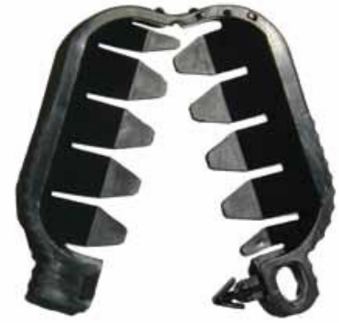
Pinza para sellado de esófago para vacuno - color negro 1012181 - 2000 en cajas - a granel 1012194 - 2000 en cajas - apiladas