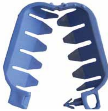
Pinza para sellado de esófago para vacuno - color azul 1012156 - 2000 en cajas - a granel 1012206 - 2000 en cajas - apiladas