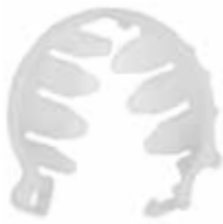
Pinza para sellado de esófago para ovino 1012135 - color blanco - 6000 en cajas - a granel 1012173 - color azul - 6000 en cajas - a granel