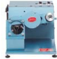
Afilador de cuchillas