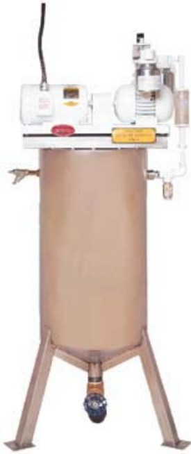
Sistema de aspiración