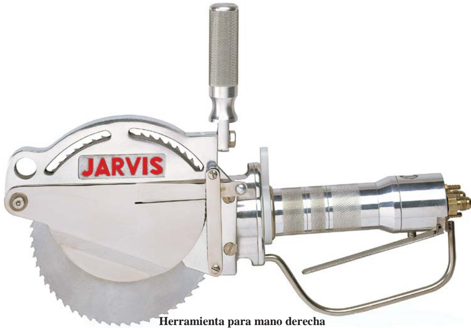
Herramienta para mano derecha

Las sierras hidráulicas ideales de corte para un uso general Mod. SHC 205 de Jarvis.