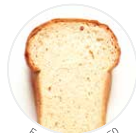
Falling Number 250