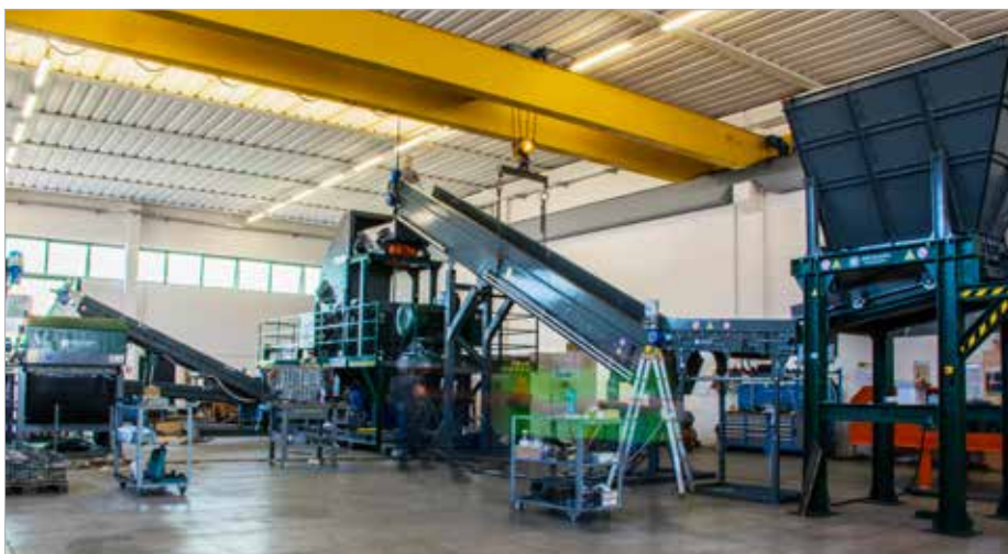
Panizzolo plant with FLEX 1000, Eddy Current SMNF 1000 and Loading Hopper PZ 1000 Planta Panizzolo con FLEX 1000, Corrientes de Foucault SMNF 1000 Tolva de Carga PZ 1000