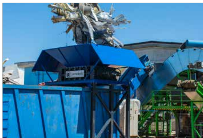
PZ 2 H 2000 shredder / Cizallas rotativas PZ2 H 1500