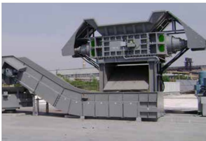
PZ 2 H 2000 shredder / Cizallas rotativas PZ2 H 2000