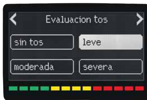
Muestra indicador de síntomas