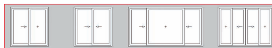
Formas de apertura PremiLine