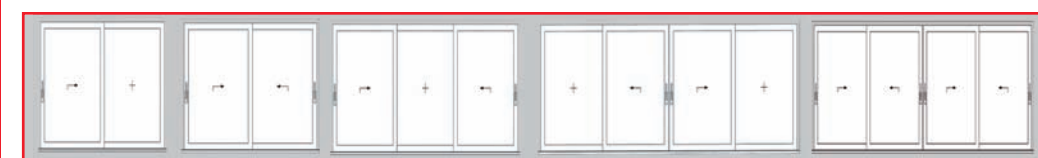
Formas de apertura PremiDoor