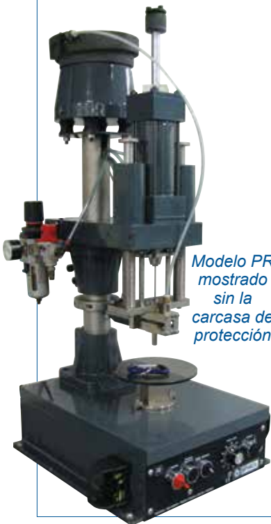
Modelo PR mostrado sin la carcasa de protección

De esta manera se aumenta significativamente la productividad y la calidad de instalación.