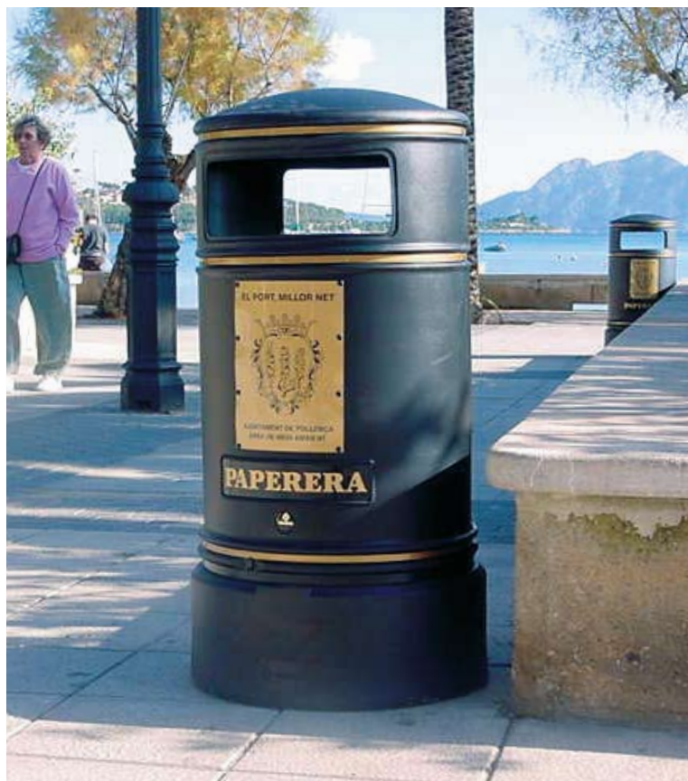
Modelo con bandas decorativas y leyendas en dorado.