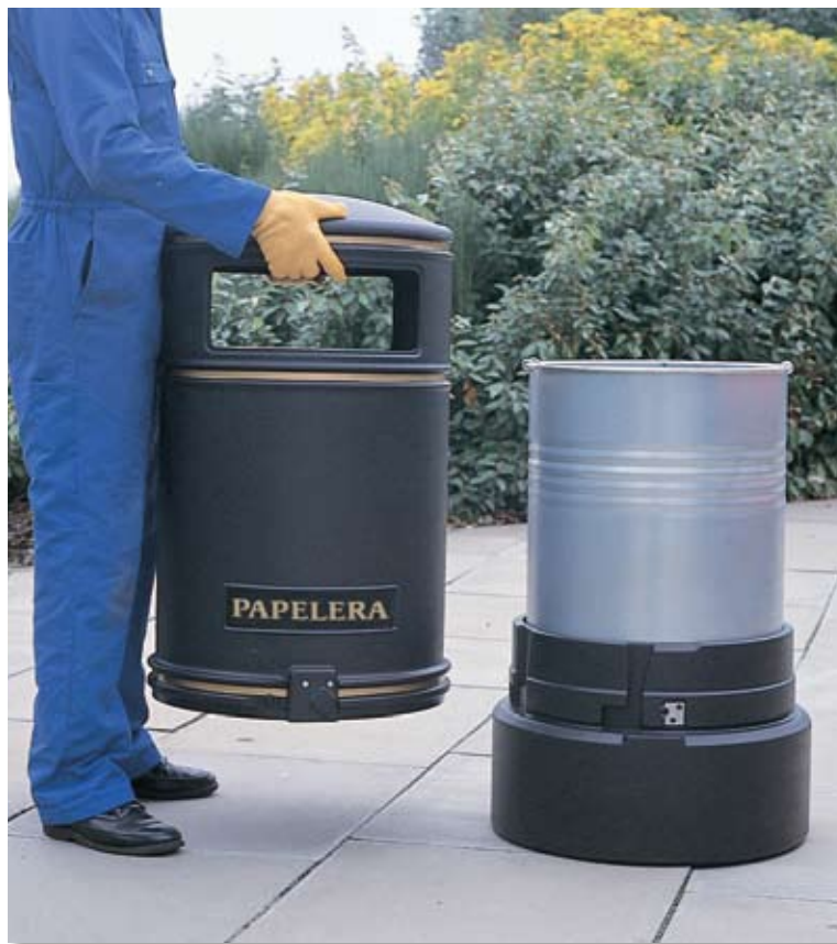
Fácil manipulación y vaciado.