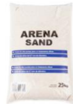
Arena de Sílice