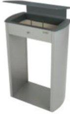
Cenicero arenero Sahara con techado