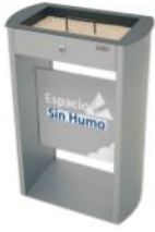
Cenicero arenero Sahara con soporte de publicidad