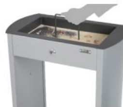
Uso de rejilla de limpieza