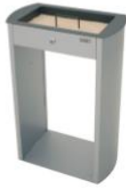
Cenicero arenero Sahara con rejilla limpieza de arena