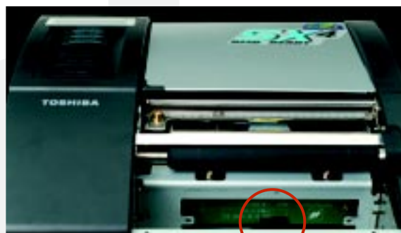
▲ Antena RFID UHF

IBEC SYSTEMS S.L. PLAZA AMEZOL, 4 - 48012 BILBAO TEL. 94 444 66 56 - FAX. 94 422 20 39 www.ibec.es