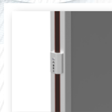
Sensor de temperatura corporal integrado en el panel lateral del arco