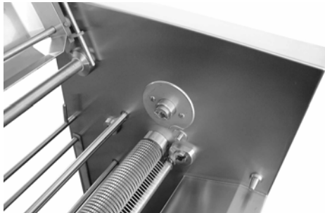
Rodillo de tracción dentellado con dientes medianos o gruesos con rastrillo-limpiador de los equipos NOCK, mod. CBF y CF

Un sistema de limpieza adicional por inyección de agua en el interior de la máquina impide la acumulación en el rodillo de tracción de material desprendido, lo que garantiza el funcionamiento confiable continuo.