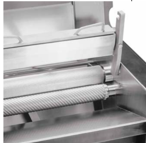
Rodillo de tracción dentellado fino con rodillo de limpieza para los modelos Skinex SB 495, S 460 y S 420

Los dientes del rodillo de tracción dentellado del modelo Skinex SB 495 son más finos que los del modelo Cortex CBF 495 y no tienen ranuras debido a la ausencia del rastrillo-limpiador.