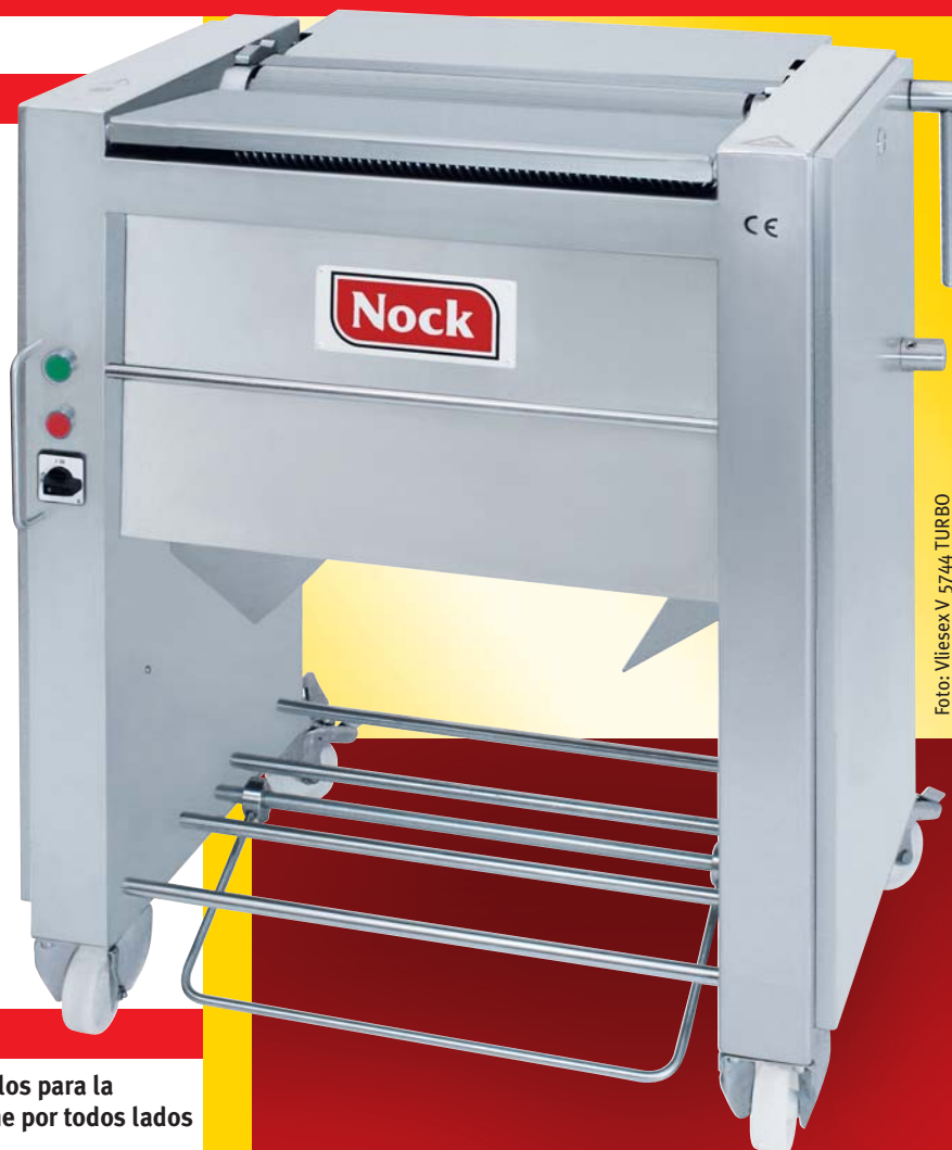
Foto: Vliesex V 5744 TURBO