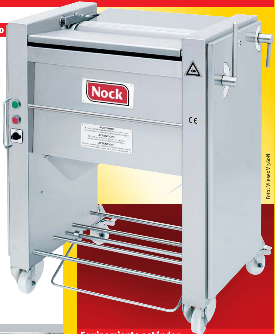
Foto: Vliesex V 560N