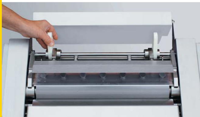
Sistema de cambio rápido de la cuchilla