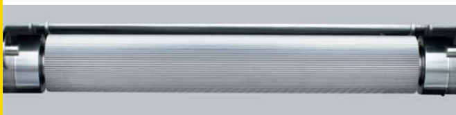
Rodillo de transporte