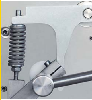
Amortiguación por resortes del porta cuchilla