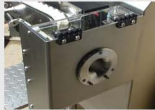
Altura de la boca de alimentación para sistema de trabajo ergonómico.