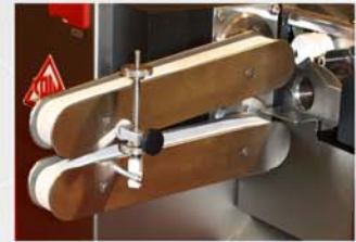
Salida automática del producto mediante cintas de caucho alimentario.