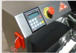
Programador standard de mercado para todas las funciones.