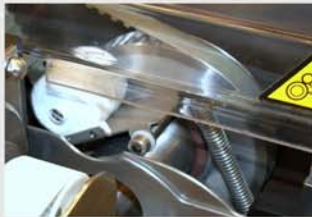
Cambio rápido de bobina de hilo.