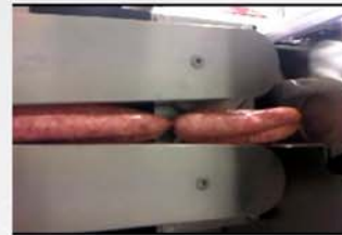
Uniformidad de porciones.