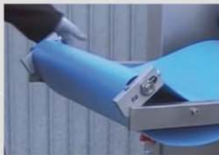
El fácil desmontaje de las bandas sin herramientas, facilita el mantenimiento y la limpieza