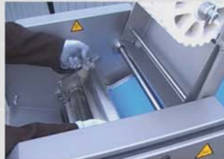
La extracción fácil y rápida del portacuchillas minimiza los tiempos de cambio de cuchilla.