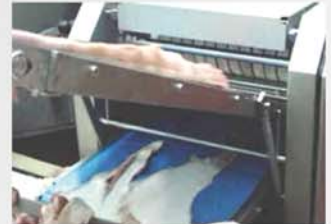
La tercera cinta de salida corteza, opcional, aumenta la versatilidad en cadenas en serie.