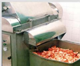
Troceado apto para picadora y cutter sin atemperar.