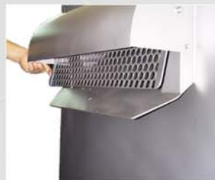
La puerta basculante de la boca de salida, evita accidentes y permite una salida más controlada del producto.