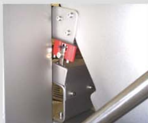
Sus sistemas de alta seguridad aseguran su uso con las normativas más estrictas.