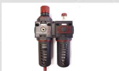
El grupo de filtro de aire de 1/2" asegura la máxima higiene.