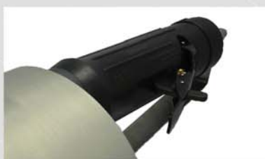
Motor de alto rendimiento. Prestación ergonómica y nivel acústico saludable.