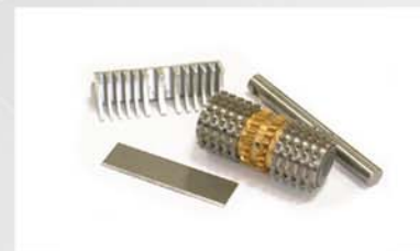
El rodillo y el peine se extraen en unos pocos segundos para una limpieza efectiva.