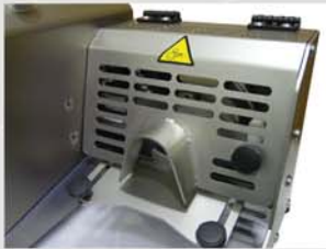
Tapa de seguridad de acero inoxidable.