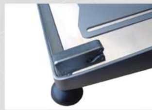
Su diseño sin base, evita la acumulación de suciedad facilitando la limpieza.