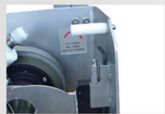
Enhebrador incluido con soporte integrado junto a la llave para desmontaje de cuchillas.