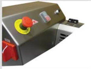
4 patrones de intervalo entre atados para adaptarse a todo tipo de productos. Un led luminoso indica el modo activado.