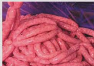
La gran precisión en el ajuste del atado posibilita atados de gran dificultad como la triple salchicha.