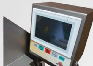
Una pantalla táctil muy intuitiva, permite obtener resultados desde el primer día con un aprendizaje mínimo.