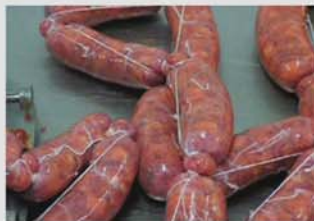
Una gran versatilidad de patrones de atado permite atar productos como la bola gallega.