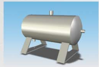
El sistema neumático, está provisto de un calderín de expansion para mantener una presión constante, minimizando las fluctuaciones de la red.