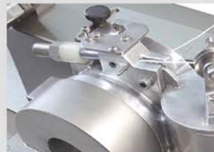
Ajuste de tensión del hilo regulable.