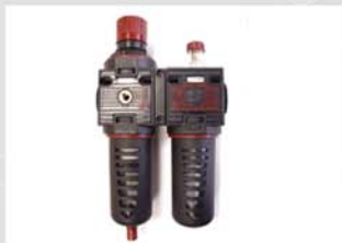
Filtro de autolubricado de purga automática, incluido.