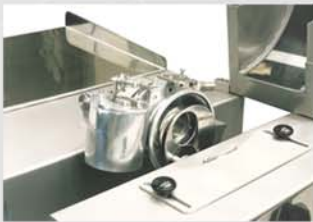
Bandeja articulada para ajuste a diferentes alturas de mesa, de serie.