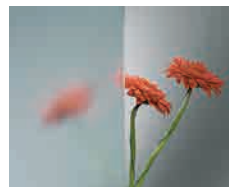
Linea Azzurra Base de vidrio float de color ligeramente azulado