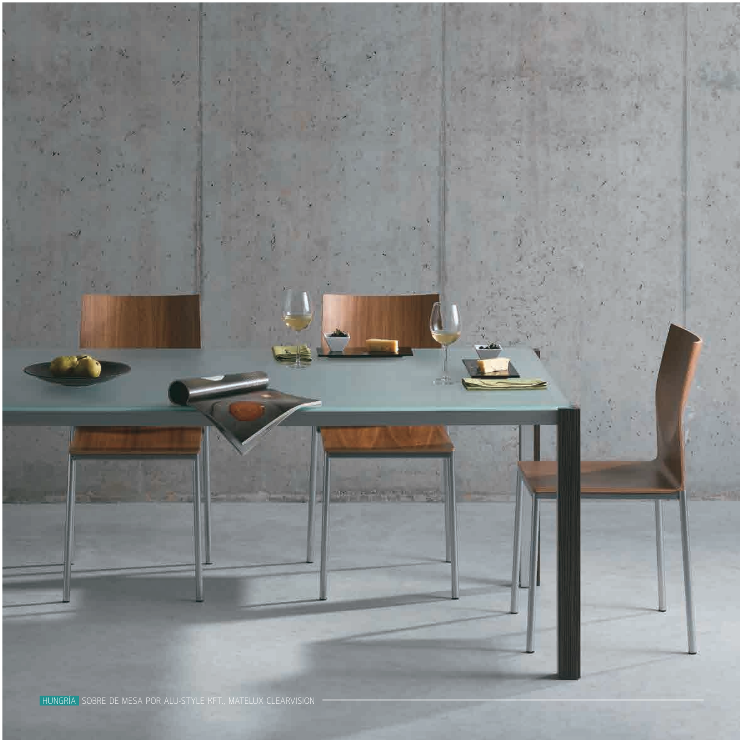
HUNGRIA SOBRES DE MESA POR ALU-STYLE KFT., MATELUX CLEARVISION