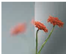
Clear Base de vidrio float normal