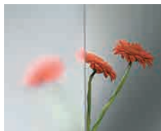
Clearvision Base de vidrio óptico altamente transparente para lograr una estética neutra