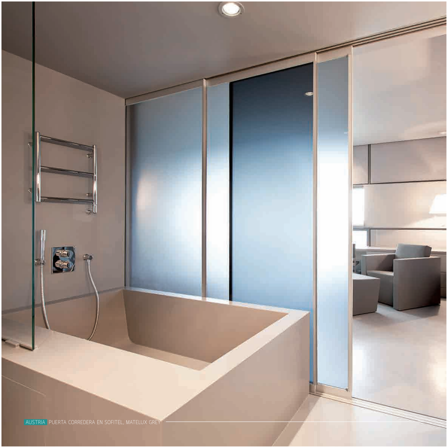
AUSTRIA PUERTA CORREDERA EN SOFITEL, MATELUX GREY