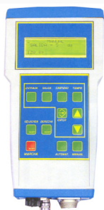
SONAR DOBLE (OPCIONAL)