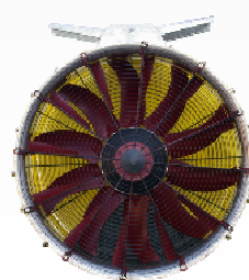
DIRECTRIZ EN « V » (OPCIONAL)