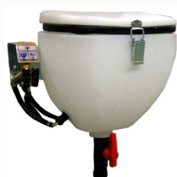
PREMECLADOR PRODUCTOS 40L (OPCIONAL)