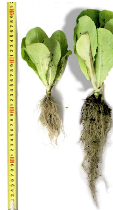
Ejemplares de lechuga sin tratar (izquierda) y tratada con CORRIZ-AM® (derecha) vía riego a 5 L/Ha a los 35 días del tratamiento.

CORRIZ-AM® puede ser empleado en mezcla con los productos más comunes aplicados con el riego, si bien, en caso de duda, se recomienda hacer una prueba previa o consultar al Servicio Técnico de Agrométodos.