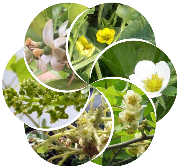
Momento idóneo para la aplicación de BIOHIDRAMAR® CUAJE en cítricos, sandía, fresa, kiwi, aguacate y uva de mesa.