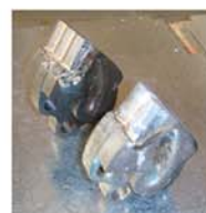
Sistema FIXE TOP