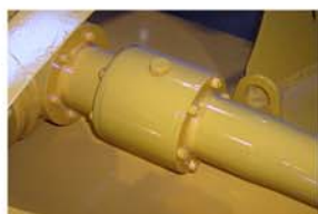
Rueda libre en manga