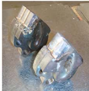
Sistema FIXE TOP