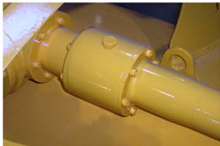
Rueda libre en manga