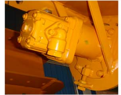
Motor hidráulico de engranajes