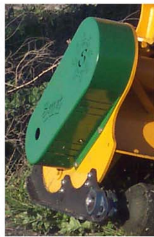
Transmisión por correas del cabezal F3