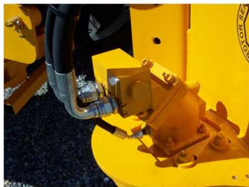
Circuito hidráulico cerrado